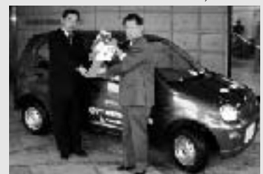
埼玉県生命保険協会より 軽自動車を寄贈いただきました。